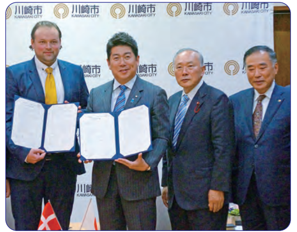
デンマークのオーデンセ市と平成27年12月1日には「経済産業交流に関する覚書」を締結