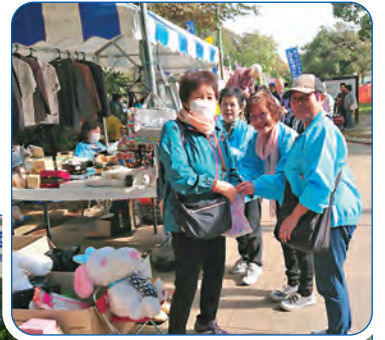
明るく出店を盛り上げる「ひまわりクラブ」の皆さん

2018年10月20日に第41回多摩区民祭が生田緑地で開催。9万2千名の参加者で、晴天にも恵まれ大成功の区民祭となりました。また毎年多くの区民で賑わう出店コーナーでは市民団体の「ひまわりクラブ」の皆さんが活躍されていました。