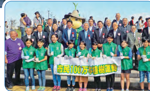
記念撮影する「すがわら進」議員(2列目の真ん中)